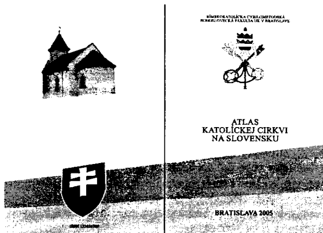
Obr. 3 Návrh obálky atlasu vo veľkosti A4 od J. Poláčíka