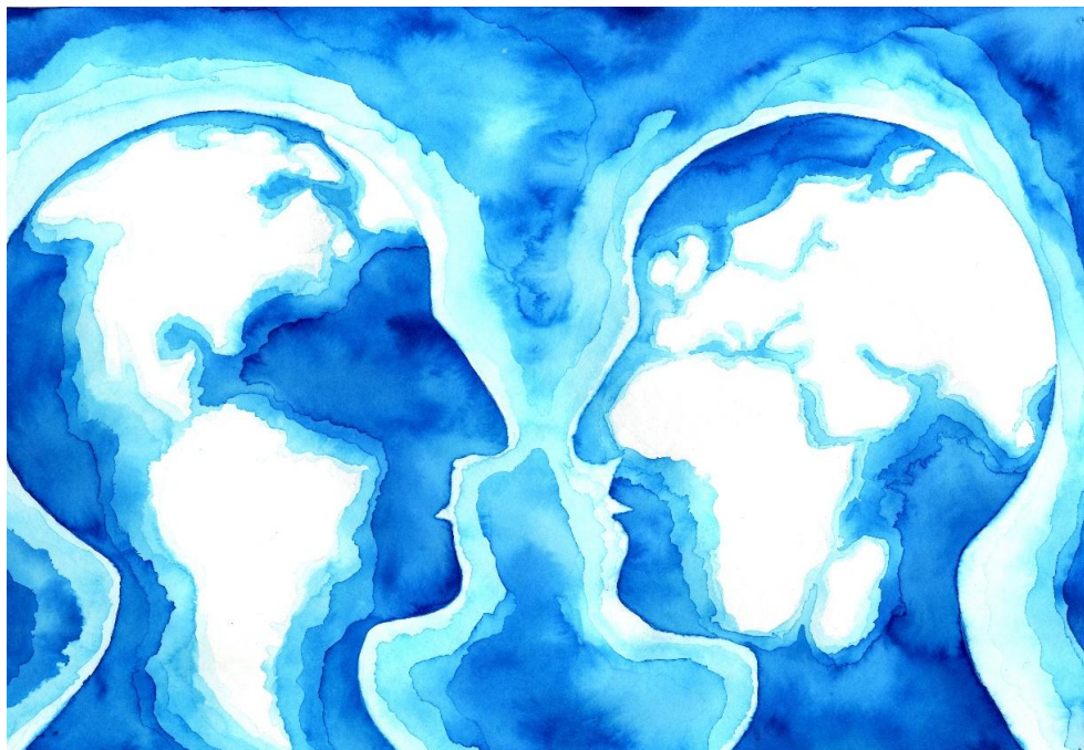
Obr. 4 Katarína Šáleková: Hemispherical Understanding