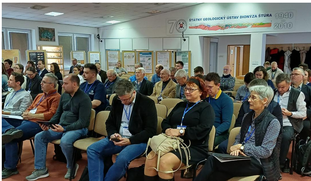
Obr. 1 Účastníci konferencie, foto Ing. Július Bartaloš, PhD.